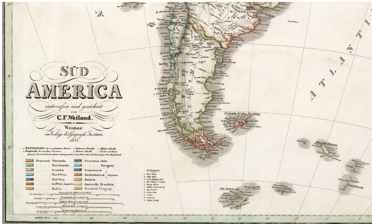
David Rumsey Map Collection. https://bit.ly/2WGkhlP

El comandante Vernet se trasladó a Buenos Aires para defender su proceder y presentó en 1832 el “Informe del Comandante Político y Militar de Malvinas”. En el descargo sobre sus actuaciones ofrece, por una parte, la primera exposición de los derechos territoriales de las Provincias Unidas sobre Malvinas y las costas del continente hasta el cabo de Hornos. Vernet argumenta que la posesión efectiva de las Islas Malvinas por España fundamenta la sucesión de sus derechos en el gobierno independiente –sea por herencia, cesión, venta, permuta o tratado– que legitima la ocupación de las islas en virtud de la adopción del derecho de gentes. Es decir, las Provincias Unidas del Río de la Plata como sucesoras del virreinato son herederas de las acciones españolas de posesión, física o simbólica, tanto de las costas atlánticas de Patagonia como de Tierra del Fuego y Malvinas. Por otra, realiza consideraciones acerca de los límites jurisdiccionales formales de la comandancia que se remitían a las divisiones españolas. Señala que el territorio del virreinato “comprendía a Malvinas; sabiendo que él se extendía hacia el polo austral hasta el cabo más meridional de la América del Sur” y que “la costa toda se dividió en tres distritos: el primero desde el cabo San Antonio hasta Santa Helena: de aquí hasta el estrecho, el segundo; y del estrecho adelante, incluso la isla de los Estados, y adyacentes, pertenecía a la Comandancia de Malvinas, que hacía el tercero” (Vernet, 1904, p. 25).