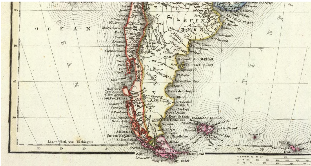
Figura 4. Meyer. Detalle. Sud America. Nach den neuesten Materialien gezeichnet. 1854.