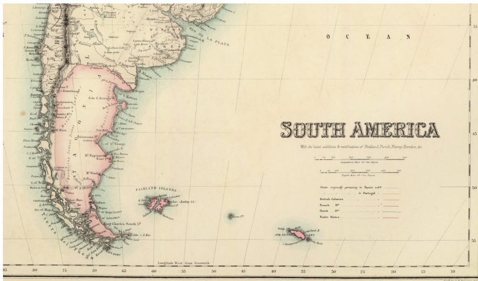
David Rumsey Historical Map Collection. https://bit.ly/3zl6EAB

La “anexión cartográfica”, mediante el colorado al Native State , permite suponer una “territorialidad sin territorio” sobre la Patagonia oriental y Tierra del Fuego y parece sugerir las aspiraciones o deseos de actores imperiales británicos de controlar este territorio y la posibilidad de acuerdos con las naciones originarias tendientes a lograr su uso, pero no la ocupación. Si bien implicaba el reconocimiento de la territorialidad tehuelche o el dominio territorial, 4 el territorio continuaba en manos de los pueblos