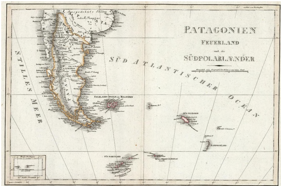
Figura 1. Weiland, C. Geographisch-statistische und historische Charte von Patagonien, Feuerland and die Südpolarländer. 1828.