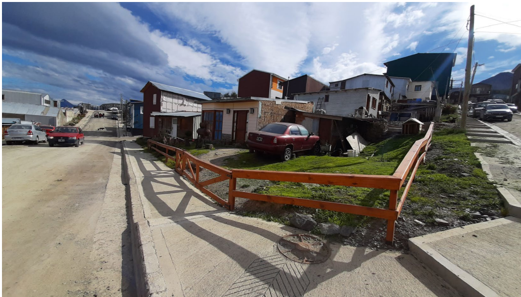
Figura 4: Viviendas modificadas a partir del proyecto de reurbanización.

La autoconstrucción permite también la decisión de cada familia sobre cómo habitar su lote dentro de los parámetros urbanos ya establecidos. Así, la satisfacción de las necesidades humanas se despliega a las particularidades de cada vecino y vecina; si quieren tener un cubículo externo para su mascota, una parrilla para hacer asados, una zona para estacionar el auto o para las plantas, así como también cuáles van a ser las dimensiones y la distribución de los ambientes que construyan. Se trata del derecho y la decisión sobre cómo habitar el espacio, cómo asentarse/fijarse sobre el lote y sobre cómo proyectarse dentro del barrio y la ciudad. En este sentido, las planificaciones familiares dan cuenta de un progreso social, de un desarrollo a escala humana, que permite realizar planes a largo plazo así como transformarlos de acuerdo con sus trayectorias particulares (Figura 4).