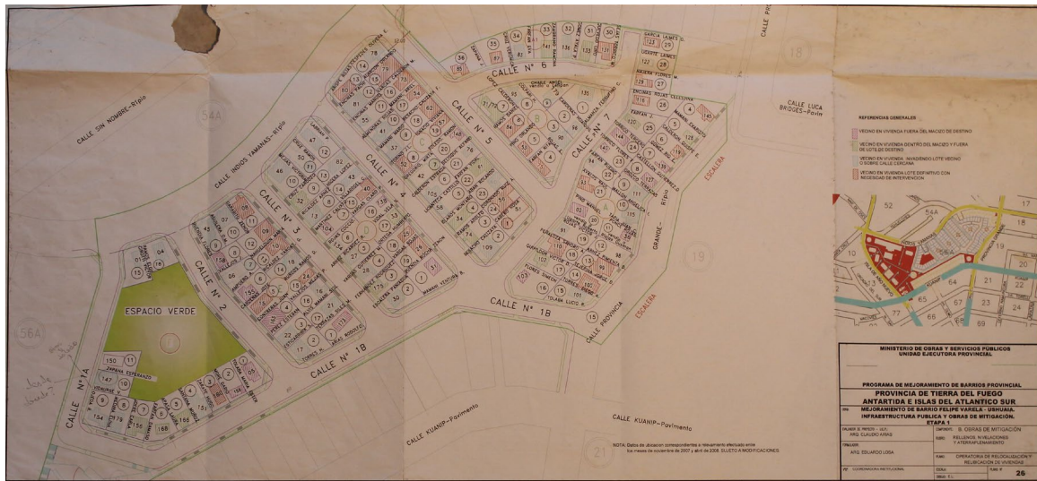
Figura 3: Proyección de las relocalizaciones y el entramado urbano al finalizar la fase 1 del proyecto.