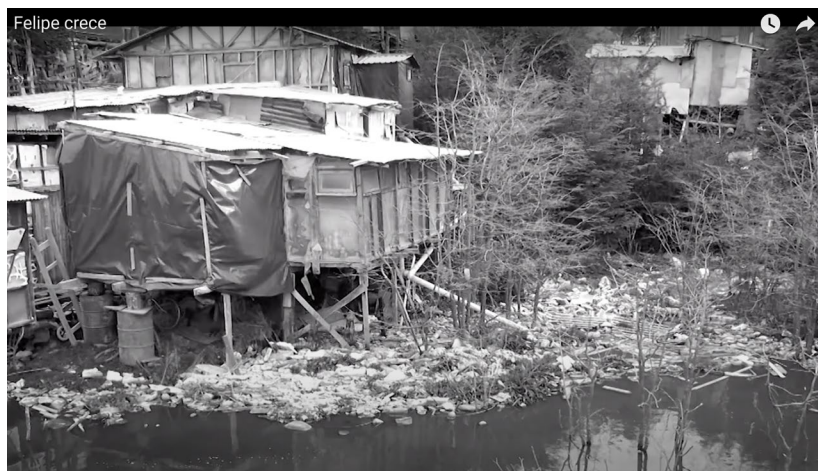
Figura 2: Imagen del barrio Felipe Varela antes del proyecto de reurbanización.